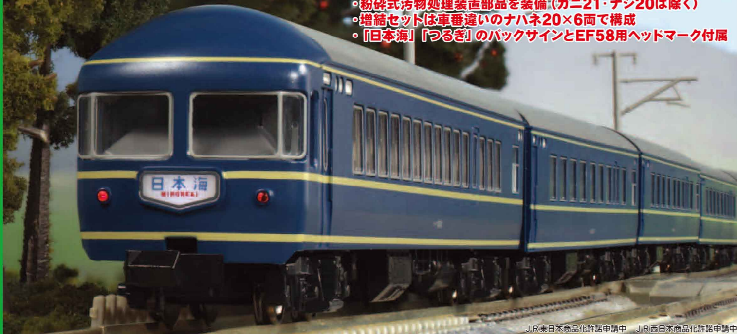
JR東日本商品化許諾申請中 JR西日本商品化許諾申請中 JR東日本商品化許諾申請中 JR西日本商品化許諾申請中