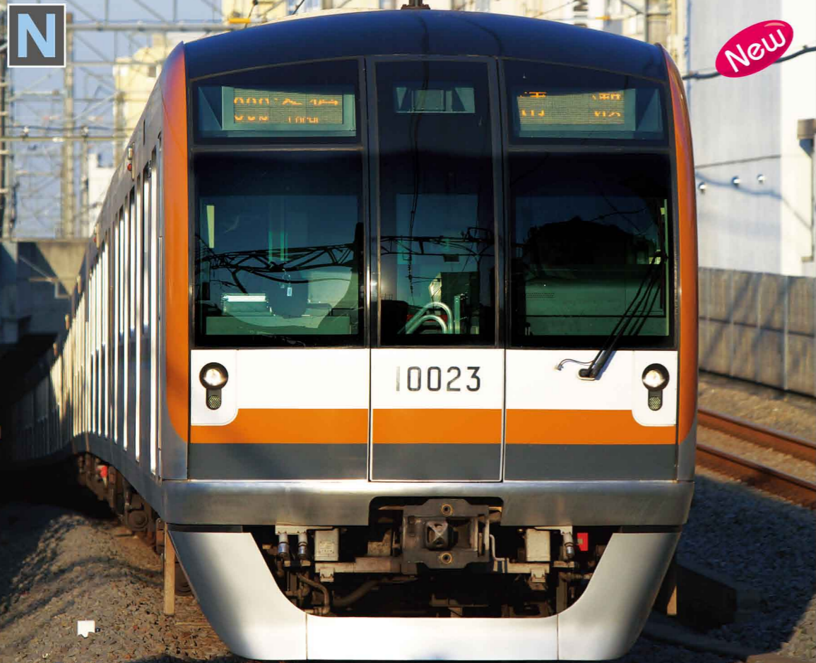
東京メトロシリーズ第2弾

6両基本セット 10-866 ¥16,800 4両増結セット 10-867 ¥8,400